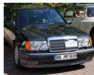
Mercedes-Benz 500E W124