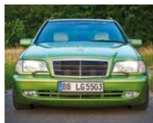
Mercedes-Benz S202 C43 AMG (Limette)