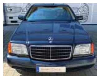
Mercedes-Benz 600 SEL W140

Verbaubar in folgenden unserer Fahrzeuge und vielen mehr: