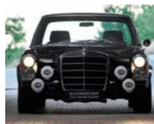
Mercedes-Benz 280 SE W108 (Schwarzer Eber)